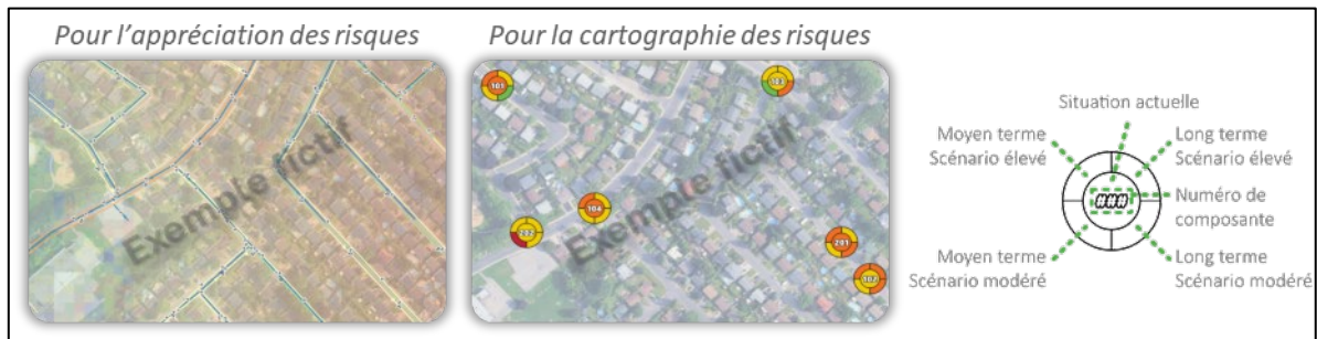
Figure 3. Exemple fictif de l'intégration d'outils cartographiques dans une démarche d'analyse de risques. À gauche, les données cartographiques sont utilisées pour l'appréciation des risques et, à droite, pour représenter les risques spatialement.

L'ensemble du processus s'appuie sur un système d'information géographique (SIG), permettant d'intégrer les données publiques et municipales et de représenter spatialement les niveaux de risque. La cartographie peut être utilisée lors de la partie d'appréciation des risques ainsi que pour représenter les risques spatialement comme dans l'exemple fictif illustré à la Figure 3.